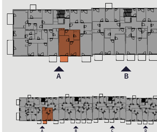
Pohled na dům | Building View